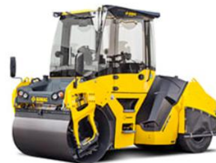
BOMAG BW BW 151 AC-50