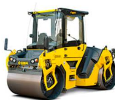
BOMAG BW 161 AD-50