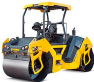
BOMAG BW 151 AD-50