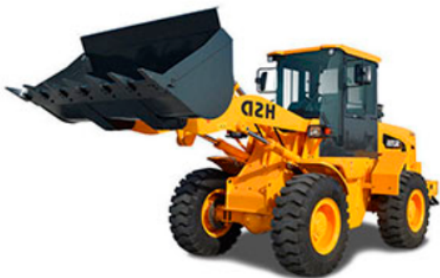
Hyundai SL 735