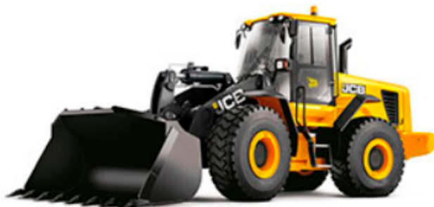
JCB 426 ZX