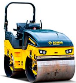
BOMAG BW 138 AD-5